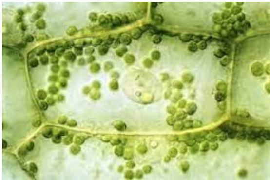
Feuille de plante aquatique

Consigne : réalise les dessins d'observation des cellules ci-dessous (une cellule par organisme). Légende tes dessins et donne un titre.